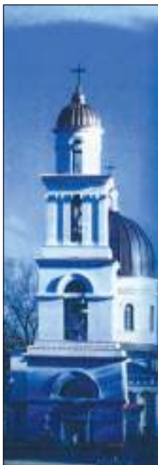
Дзвіниця (іл. 1)