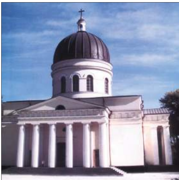
Кафедральний собор (іл. 3)