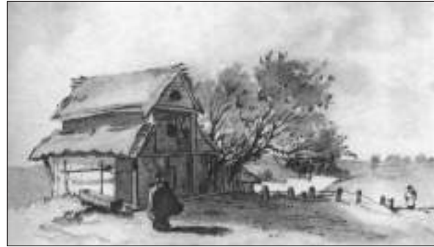
Т. Шевченко. Комора в Потоках. Акварель. Кінець серпня 1845 р.