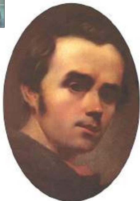
Т. Шевченко. Автопортрет. Олія. 1840. (іл. 3)