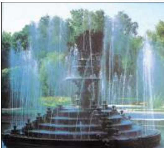
Парк. Водограй (іл. 1)