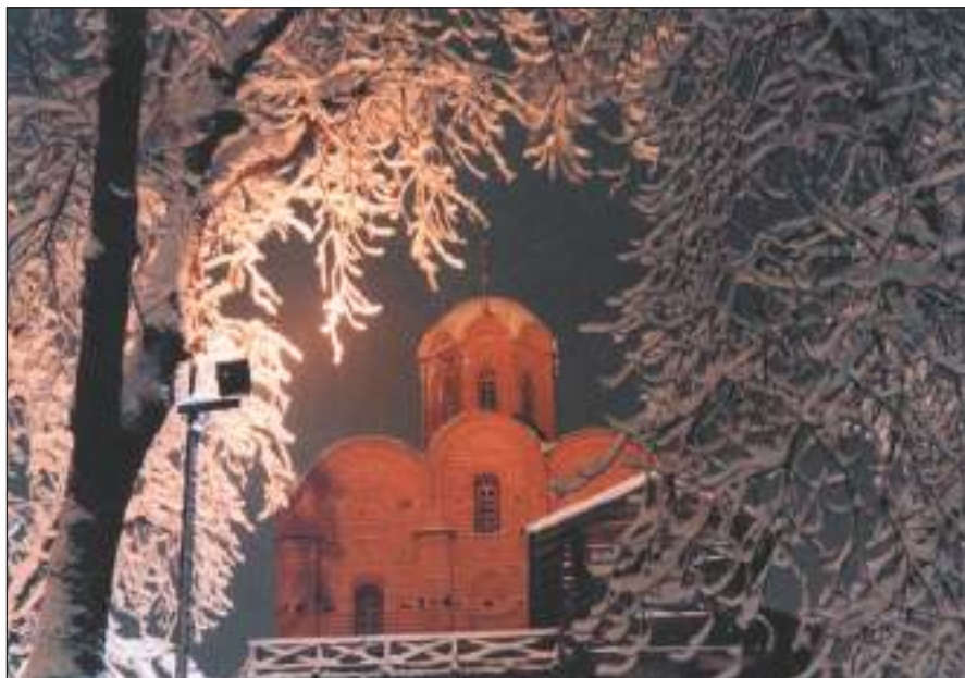
Золоті ворота. XI ст. Павільйон-реконструкція. 1982 р. (іл. 2)