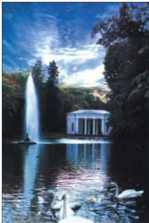
Софіївка. Павільйон Флори і Водограй «Змія» (іл. 2)