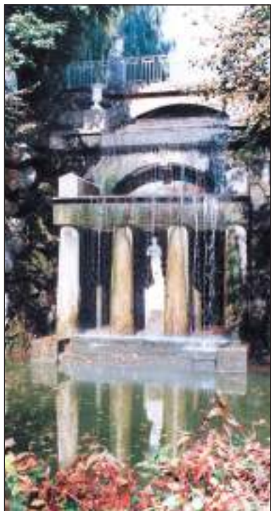
Софіївка. Грот Феміди (іл. 1)