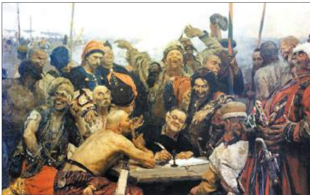
І.Ю. Рєпін. Запорозжці пишуть листа турецькому султанові (іл. 3)