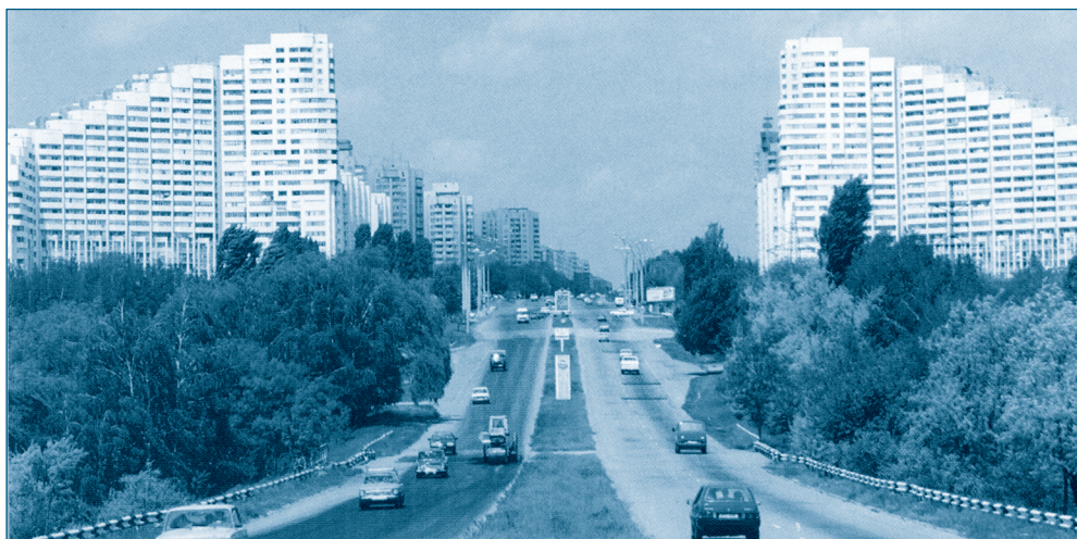
Ворота міста Кишинєва