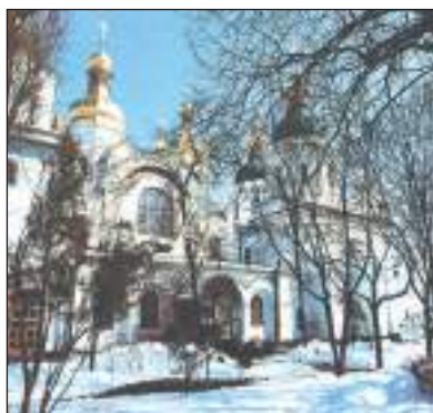
Софійський собор – головний вівтар (іл. 1)