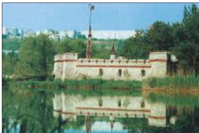
Парк «Ла ізвор» (іл. 2)