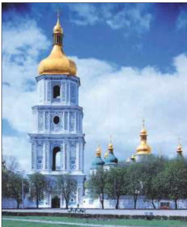
Софія Київська – дзвіниця (іл. 3)