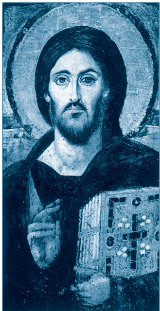
Ісус Христос. Монастир Св. Катерини. Сінай. VI ст.