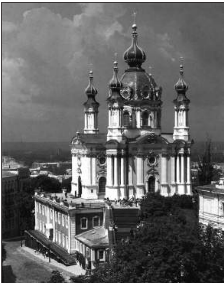
Київ. Андріївська церква. 1747–1762 рр.

1. «Мова – явище соціальне»; 2. «Історичні пам'ятки Молдови»; 3. «Історичні пам'ятки України»; 4. «Українці Молдови».