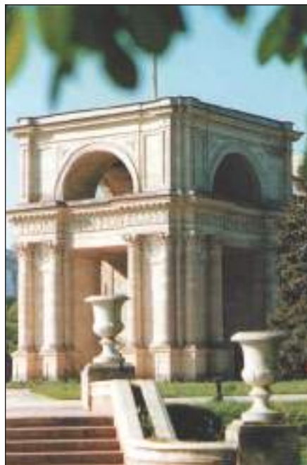
Арка Перемоги (іл. 2)